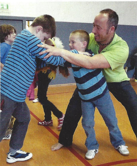
Praktische Übungen veranschaulichen die Lerninhalte